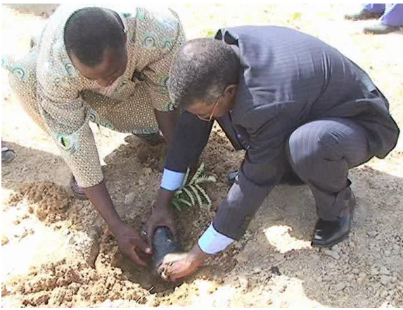
Plantation d'arbre par Mr le Ministre des ressources animales