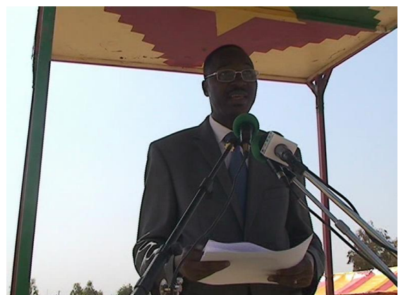
Discours de Monsieur le Ministre de la santé