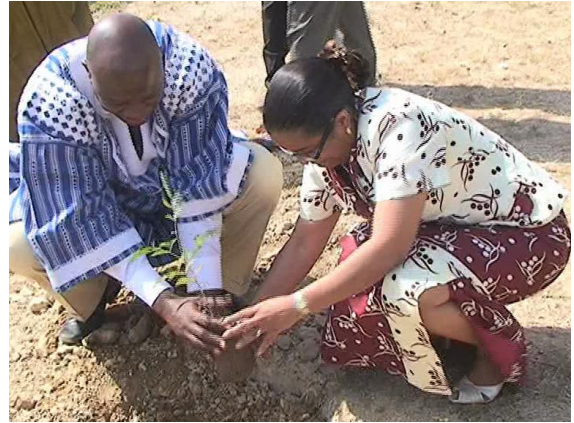
Plantation d'arbre par Mme la Représentante de l'OMS