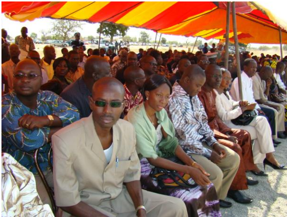
Une vue des invités