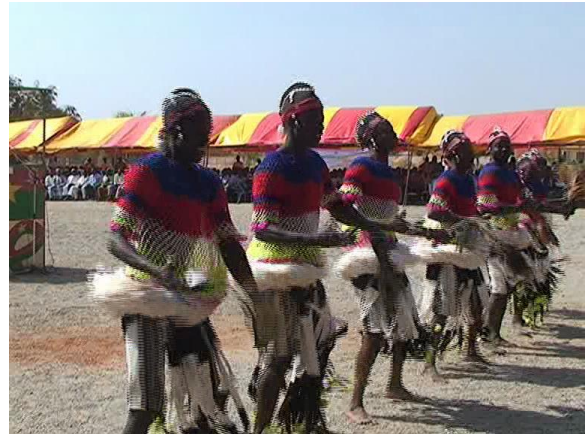
Prestation de la troupe traditionnelle