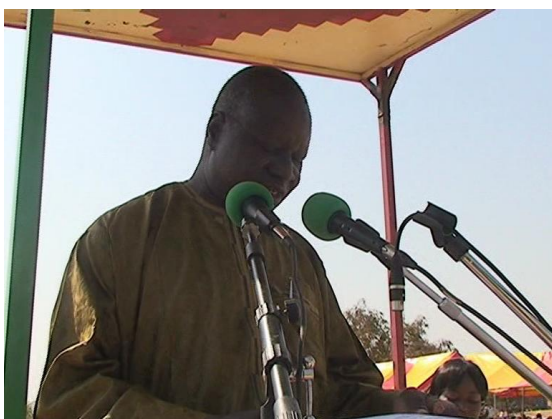
Intervention de Mr le Maire de la commune de Ziniaré