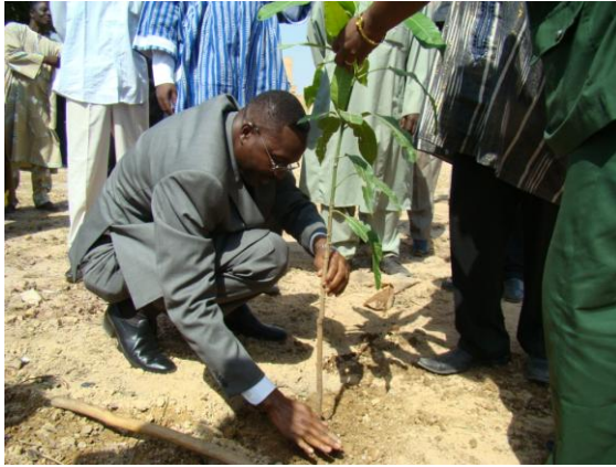
Plantation d'arbre par Monsieur le Ministre de la santé