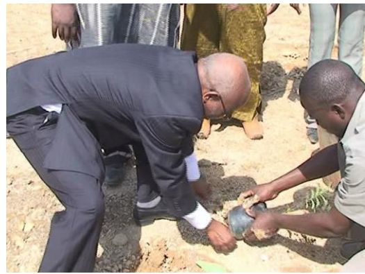
Plantation d'arbre par le Président de l'Ordre