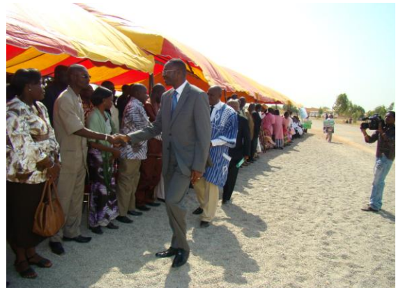
Arrivée de Monsieur le Ministre de la santé