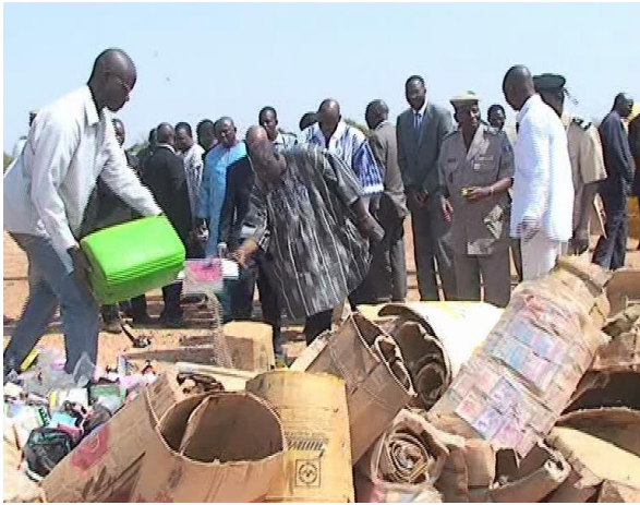
Destruction de produits prohibés