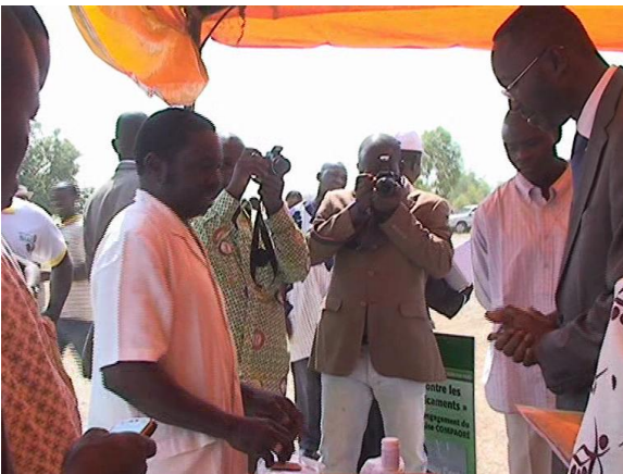
Visite des stands d'exposition de médicaments fabriqués au Burkina