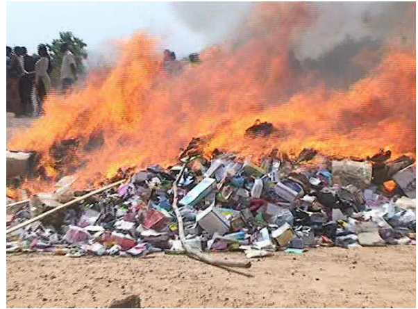
Destruction de produits prohibés