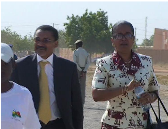
Arrivée de Mme la Représentante de l'OMS au Burkina