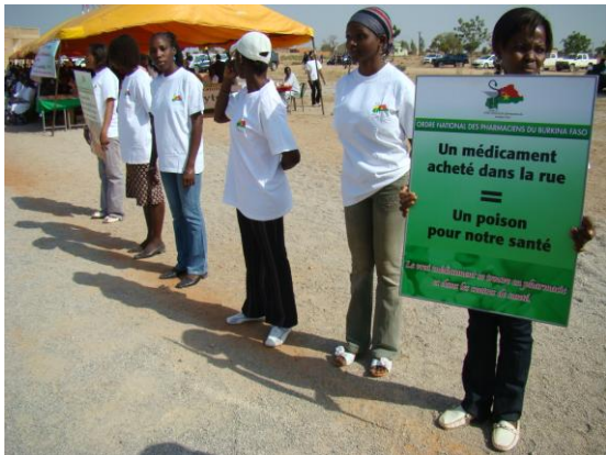
Accueil des invités