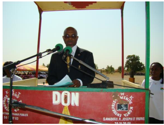
Intervention du Président de l'Ordre des pharmaciens