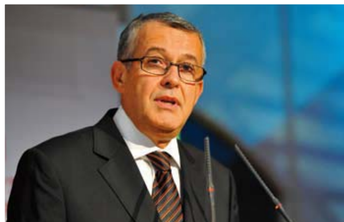
Thierry Le Lay, envoyé spécial du ministère des Affaires étrangères et européennes pour la lutte contre les médicaments falsifiés.

Mais avant de combattre un tel trafic, encore faut-il en mesurer l'ampleur. Ce fut l'objet de la première partie de ce colloque. Même si les chiffres doivent être utilisés avec prudence, les faux médicaments représenteraient 10 % du marché mondial du médicament et rapporteraient environ 50 milliards d'euros par an. Des données de l'Organisation mondiale des douanes (OMD) montrent, elles, que ce trafic aurait progressé de 300 % entre 2007 et 2008. À lui seul, il provoquerait des centaines de milliers de morts chaque année dans les pays pauvres, en particulier d'Afrique, qui sont les plus atteints. Car les experts et les acteurs locaux sont unanimes : c'est sur le terreau de la pauvreté qu'il prospère le mieux. « Dans les pays en voie de développement, les faux médicaments sont disponibles partout et en premier lieu dans la rue, sur les marchés », a souligné Thierry Le Lay, tout récemment nommé envoyé spécial du ministère des